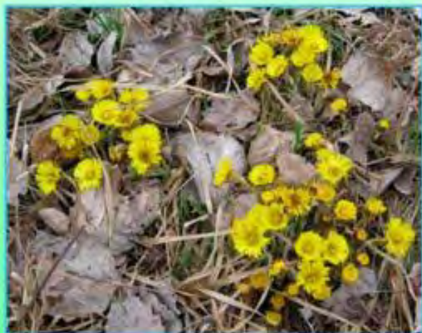
Мать - и - мачеха обыкновенная