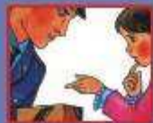
НА УЛИЦЕ ИЛИ В МЕТРО - ПОЛИЦЕЙСКОМУ