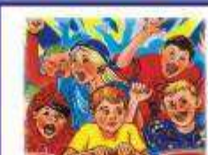
НЕ ВЫСКАЗЫВАЙ СВОЕ МНЕНИЕ ПО ПОВОДУ ПРОИСХОДЯЩЕГО, ОСОБЕННО ЕСЛИ ОНО ПРОТИВОРЕЧИТ "МНЕНИЮ ТОПЛИ".