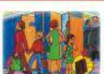
В ОБЩЕСТВЕННЫХ МЕСТАХ