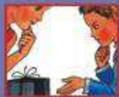
В МАГАЗИНЕ - ПРОДАВЦУ