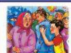
НЕ ПРИВЛЕКАЙ К СЕБЕ ВНИМАНИЕ АГРЕССИВНО НАСТРОЕННЫХ ЛЮДЕЙ.

ОБЯЗАТЕЛЬНО ПРОВЕРЬТЕ И РАССКАЖИТЕ ОБЪЕДИТЕЛЬНОСТЬ КОЛЕН НАДЫШАСЬ РАДОВА КОЛЕН И МАЙТЕ ВОЗМОЖНОСТЬ НОРМАЛЬНО ДЫШАТЬ