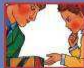
В ТРАНСПОРТЕ - ВОДИТЕЛЮ