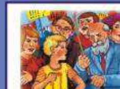
НАКОНЕЦ ВЫСОКОПЛОТНЫХ ЛЮДЕЙ ПРОПУСТИ ВПЕРЕД