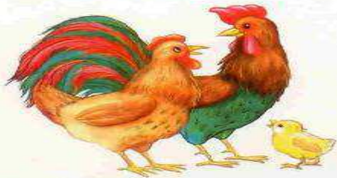
Курица — петух — цыплёнок