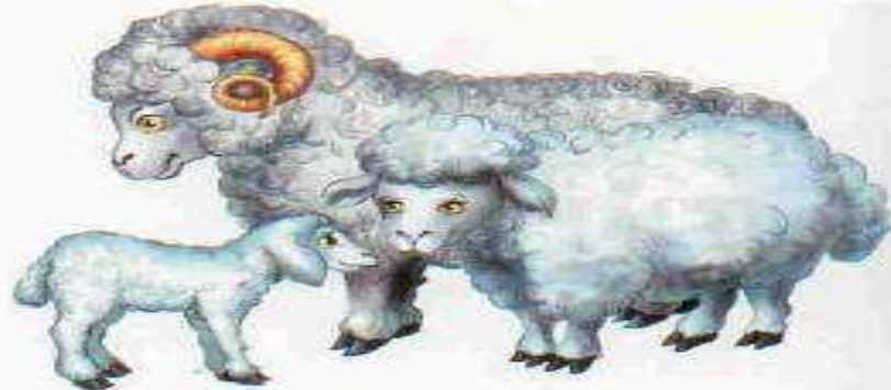
Овца — баран — ягнёнок