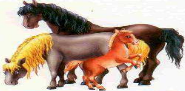
Лошадь — конь — жеребёнок