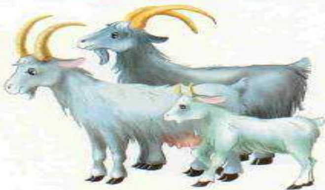
Коза — козёл — козлёнок