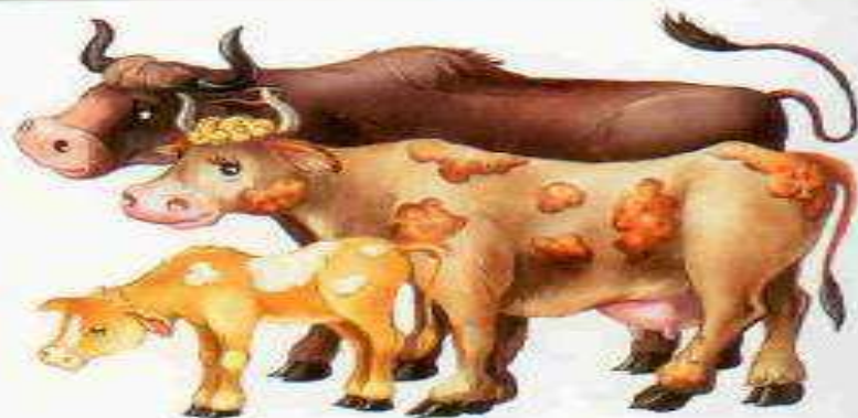
Корова — бык — телёнок