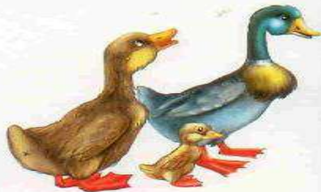
Утка — селезень — утёнок